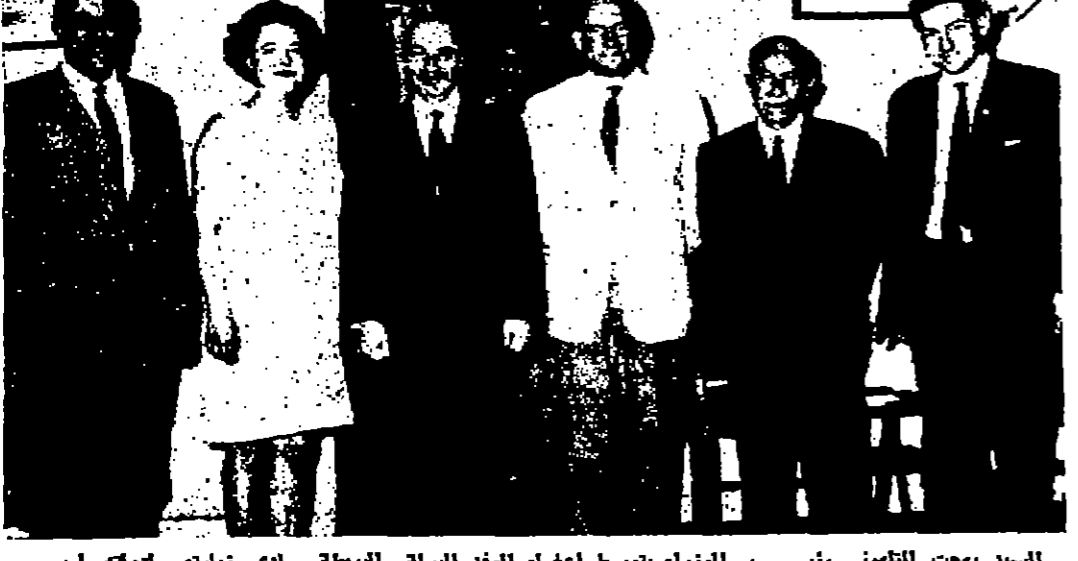
السيد بهجت التلهوني رئيس الوزراء يتوسط اعضاء الوفد البرلاني البريطاني لدى زيارتهم كوفته امس في دار رئاسة الوزراء

مقتل عدد من كبار القادة الفلسطينيين في انفجار ضخمة يظن انه من طائرة اميركية سليفون - رويتر - قتل ثلاثة ضباط فلسطينيين جنوبيين برتبة كولونيل ليلة امس في انفجار ضخم دبر مركز قيادة هو مركز العصب في المعركة ضد نوار فتحونغ في حي ثولون الصيني من سليفون وقتل في الحادث ايضا جدير مرفقا سليفون واصيب عشرة اشخاص اخرين بجروح بينهم الكولونيل فان كوا رئيس بلدية سليفون والكولونيل تران فان فان الرجل الثاني في بوليس نظام الجنوبية . ولكن من حالة الكولونيل تران خطرة . ولكن الكولونيل ان احد القتلى كان الكائنات كولونيل نوحين فان لوان جدير بوليس سليفون . وكان المنجر جنرال نوحين ثولونان قائد بوليس سليفون الجنوبية قد اصيب في سلفه خلال هجوم نوار فتحونغ على البقية على صفحة ٦ عمود ٣